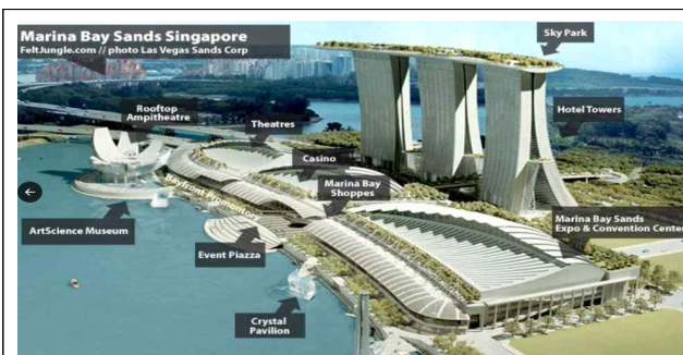
마리나베이샌즈 콤플렉스 전경