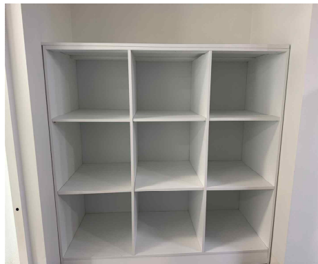
입주기업 우편 및 소포함